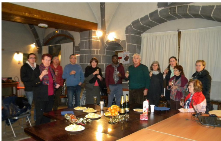
Au dernier conseil d'administration salle Ricard

Je suis convaincu que dans l'évolution de notre société et sa gouvernance, les gens aspirent de plus en plus à être partie prenante des décisions qui les concernent. J'aurais bien voulu expérimenter un budget participatif en partant de projets concrets que les habitants auraient porté eux-mêmes au sein de notre collectivité.