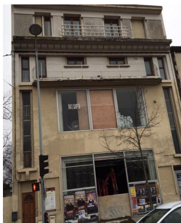
L'ancien Studio en travaux 142 avenue de La République

Voilà des choix politiques. Le comité a travaillé sur le projet de Maison pour tous pendant huit ans, avec beaucoup de montferrandais et plusieurs élus. Exercice inédit de démocratie participative.