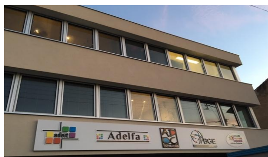
18 rue François Taravant