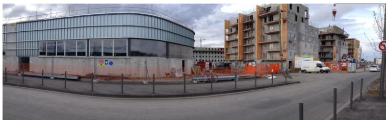
La Fac dentaire et les constructions près du CHU Estaing

♦ La rue du Ressort avec la nouvelle fac dentaire, les immeubles de bureaux et les résidences, en construction (ou déjà prévues rue Auger) près du CHU Estaing, vont drainer un flux croissant de voitures et de population. Donc un nouveau plan de circulation s'impose, surtout pour préserver l'accessibilité au CHU Estaing.