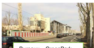
Bureaux « GreenPark »

🔔 Des bureaux « Greenpark » sont construits entre l'Hôtel République et la Carsat (Caisse de retraite).