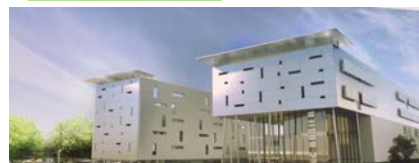
Hôtel Campanile à Gauche Ensemble scolaire Franc-Rosier à droite

🔔 Un immeuble va être édifié pour héberger le Centre national de la fonction publique territoriale (CNFPT) rue Auger juste en face du 92 ème régiment d'infanterie.