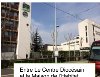
Entre Le Centre Diocésain et la Maison de l'Habitat