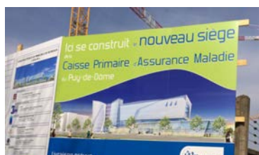
La CPAM rue Gainsbourg / rue Clos Four